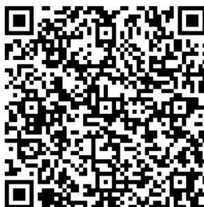
112 學年度執行成果之期末報告上傳雲端 QR CODE

https://drive.google.com/drive/folders/1MzIPZglt91uZLmJMzq3fVVvcFMaLtrWz?usp=sharing